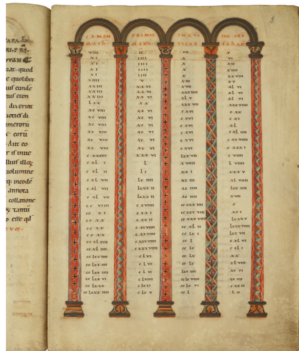
Theophanu-Evangeliar, Essen(?), um 1050